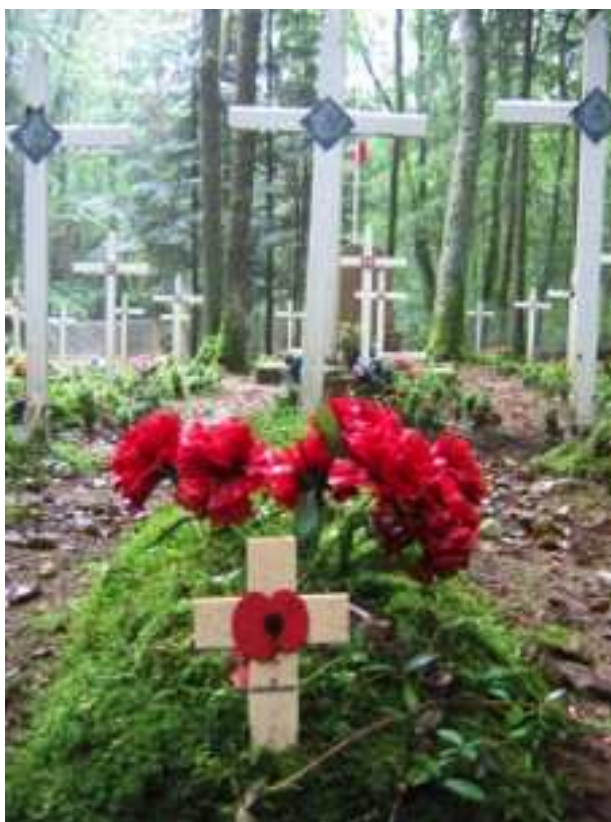
Cimetière de Coeuzon, Ouroux-en-Morvan

A travers cette exposition, Morvan terre de Résistances-ARORM rend aussi hommage au courage et au sacrifice des résistants, à la participation des alliés et aux victimes de la barbarie nazie.